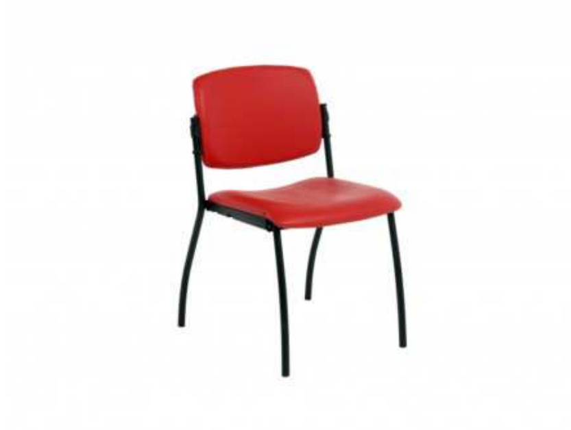
Att. Nr. 2